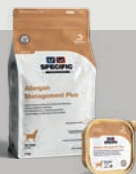
SPECIFIC™ CQD-HY & CQW-HY ALLERGEN MANAGEMENT PLUS

DIETY S HYDROLYZOVANOU LOSOSÍ BÍLKOVINOU, S RÝŽÍ A UNIKÁTNĚ VYSOKÝMI HLADINAMI EPA, DHA A GLA